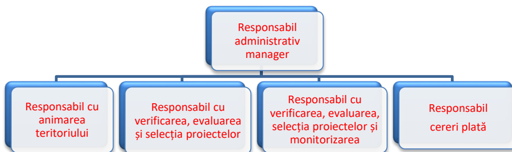
Fig. ORGANIGRAMA GAL VALEA SOMEȘULUI (Compartimentul administrativ)