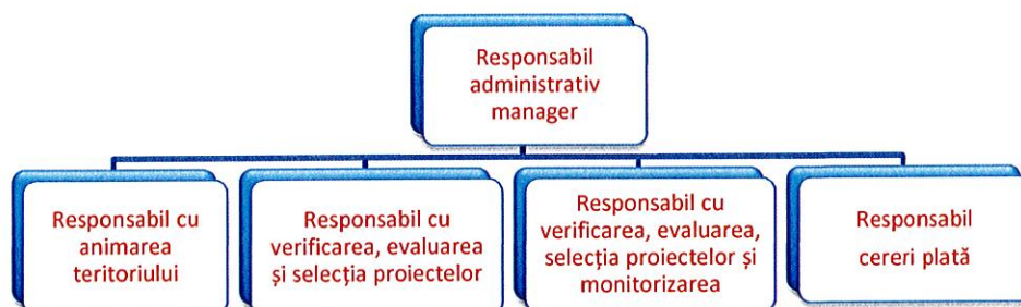
Fig. ORGANIGRAMA GAL VALEA SOMEȘULUI (Compartimentul administrativ)